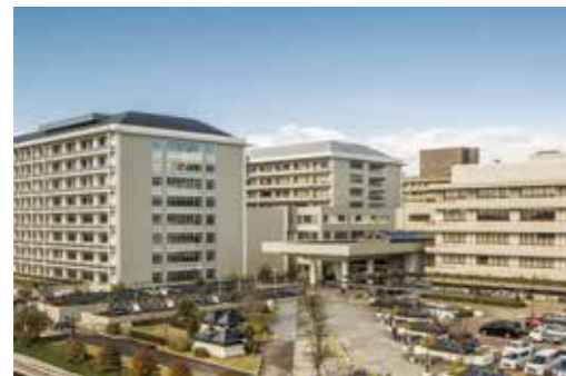
京都大学医学部附属病院 総合臨床教育・研修センター

【編集後記】 取材にあたって、ご多忙にもかかわらず貴重なお時間をいただき、誌上より厚くお礼申し上げます。取材中印象に残った言葉は、「主役は学習者」でした。腑に落ちるからこそ、高度なチーム医療実践につながるかと思えます。病院の基本理念に沿って、世界で活躍できるような広い視野を持った優れた医療人育成に取り組まれる先生方の熱意をいくらかでも伝えられればと、心より願います。